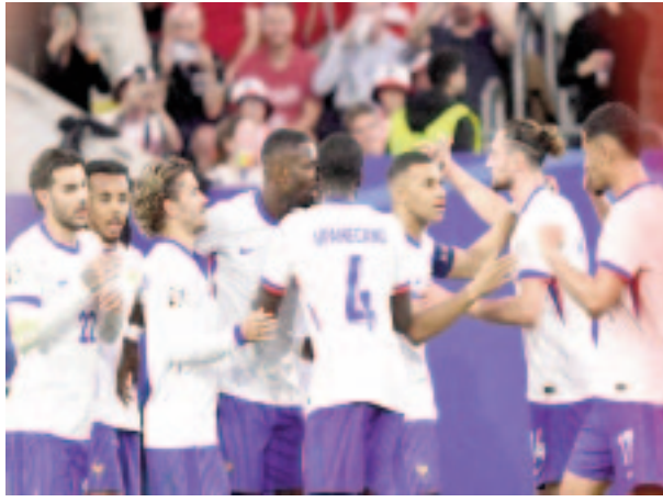
خاض 5 مباريات في نسختي 2021 و2024